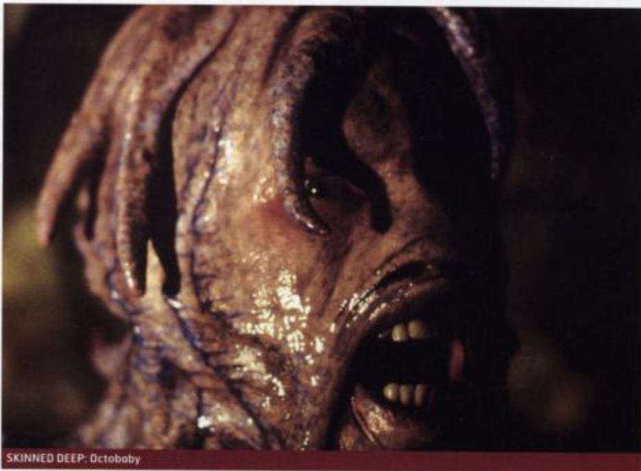
SKINNED DEEP: Octobaby