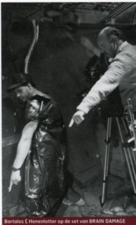
Bartalos & Henenlotter op de set van BRAIN DAMAGE

'Ik heb er heel bewust voor gekozen risico's te nemen in de toon en de acteerstijlen. Er lopen profs en amateurs in rond en het was zaak goed uit te leggen wat ik van hen verlangde. Het personage Brain ziet er volko-