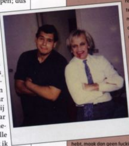
hebt, maak dan geen fucking film..."