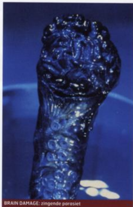
BRAIN DAMAGE: zingende parasiet

'We hebben vanuit mijn shop in de afgelopen tien jaar veel gedaan voor de CREMASTER -cyclus. Dat was tot een jaar of twee geleden tamelijk obscuur werk, nu is het enorm succesvol, zeker door de impact van het derde deel. Maar het was meteen al geweldig om te doen, omdat Matthew als kun-