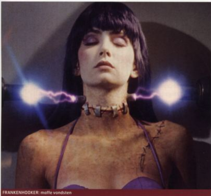
FRANKENHOOKER: maffe vondsten

'Frank is geweldig stimulerend, want als ik