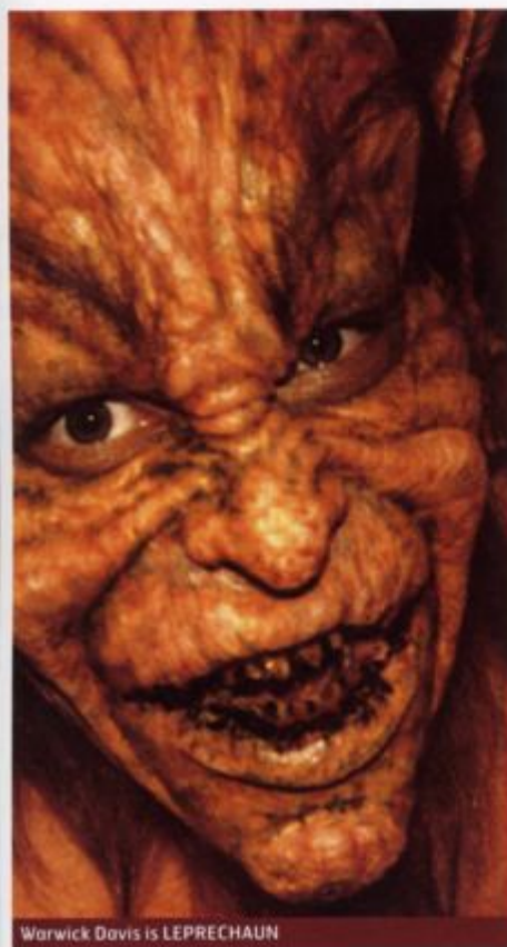
Warwick Davis is LEPRECHAUN