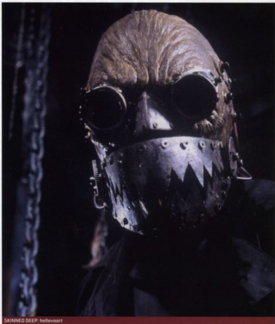
SKINNED DEEP: hellevaart

'Als kind was ik al dol op PLANET OF THE APES en GODZILLA, dat waren de eerste films die me deden beseffen dat die monsters waren gemaakt door echte artists. Ik maakte super-8-filmpjes, vol met monsters en transformaties, maar dat was een hobby. FRIDAY THE 13TH kwam als een openbaring. De trucages waren ongekend schokkend en razend knap uitgevoerd. Met zijn uitgesproken persoonlijkheid was Savini bovendien een perfect boegbeeld voor het vak, en zijn boek Grande Illusions bleek een buitengewoon inspirerende bron van informatie. Ik zou later met Tom aan THE TEXAS CHAINSAW MASSACRE 2 werken. Temidden van al die splatterfilms had je ook nog Rick Baker en die maakte special make-up effects tot een kunstvorm. Hij